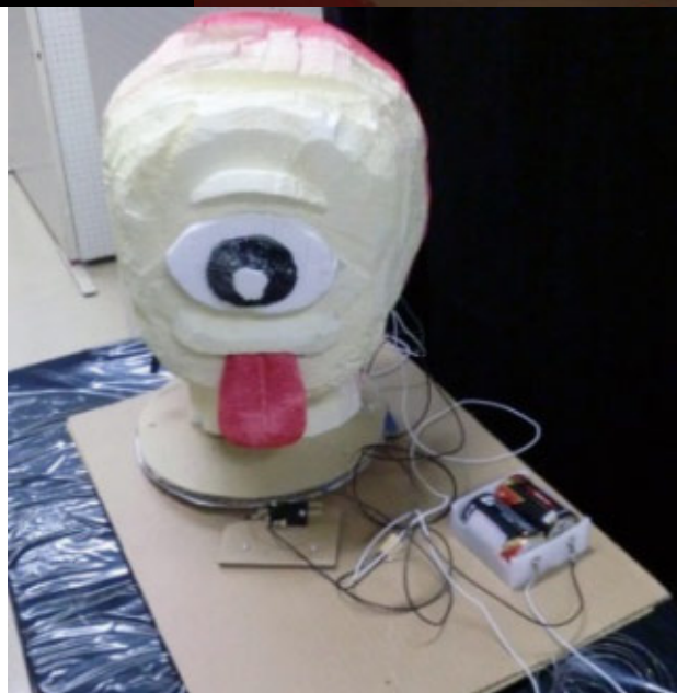
センサーで回転したり、点灯したりのお婆けやしきの小物たち