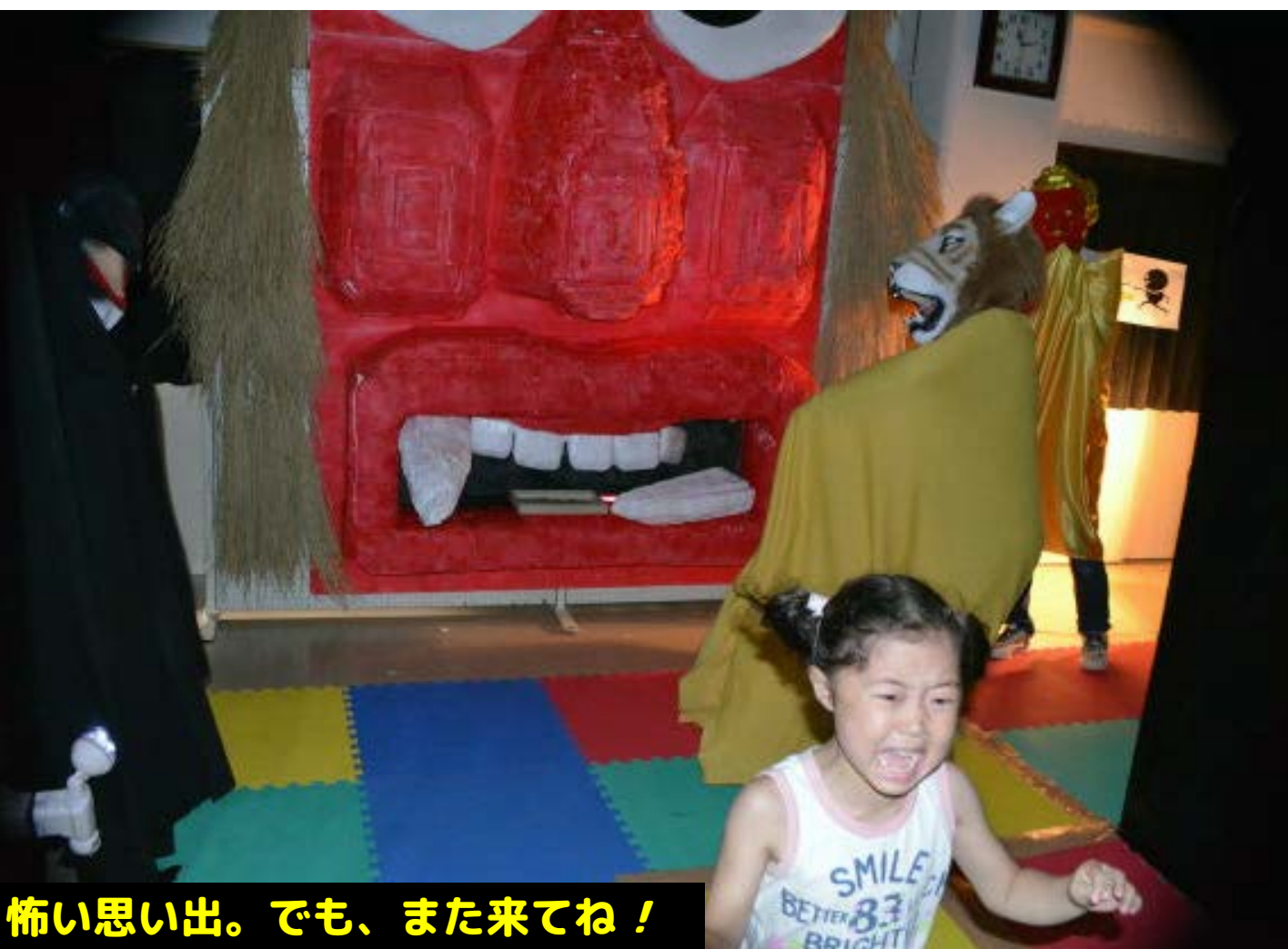
怖い思い出。でも、また来てね！