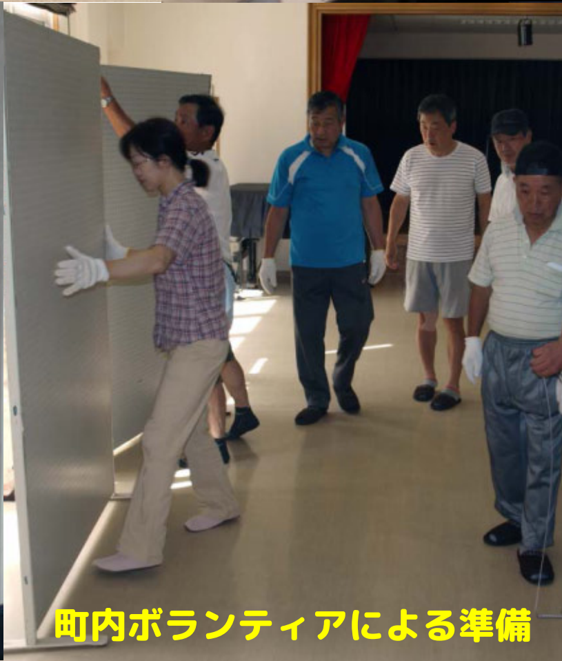
町内ボランティアによる準備