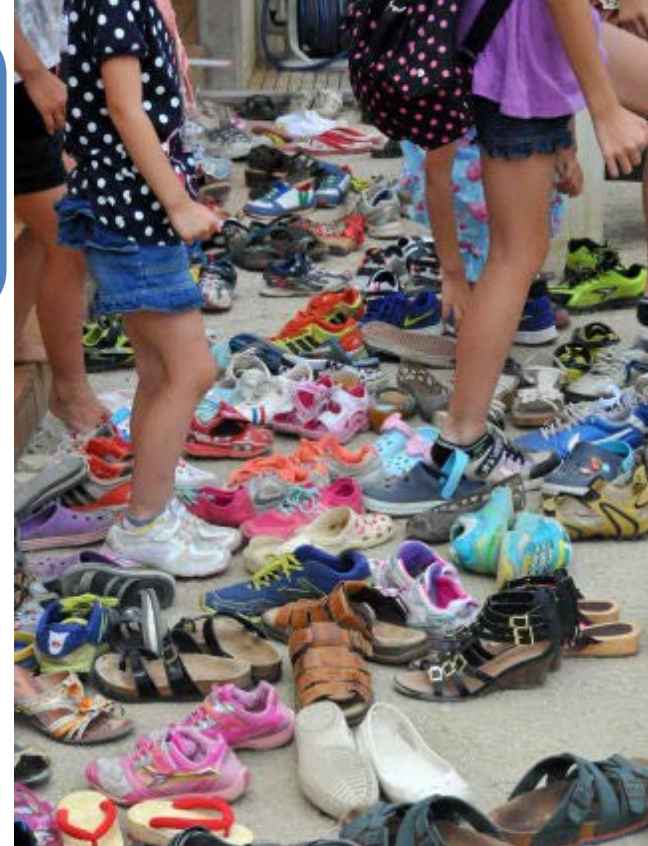
会場入口は子どもたちの靴でいっぱい...

おばけやしきは「みずき野幼稚園ホール」を使って行われ、多くのリピーター（再入場者）で盛り上がり、およそ1,300名の子どもたちが楽しみました。幼稚園の先生方は、おばけを演じたり、会場準備などに全面的に協力してくださいました。おばけやしきは、構想4ヶ月・制作2ヶ月で、町内のポケットの会メンバーを中心とした制作スタッフにより実現されました。おばけそのものは発泡スチロールで作られていて、これらは近隣の大規模店から提供を受けたものです。