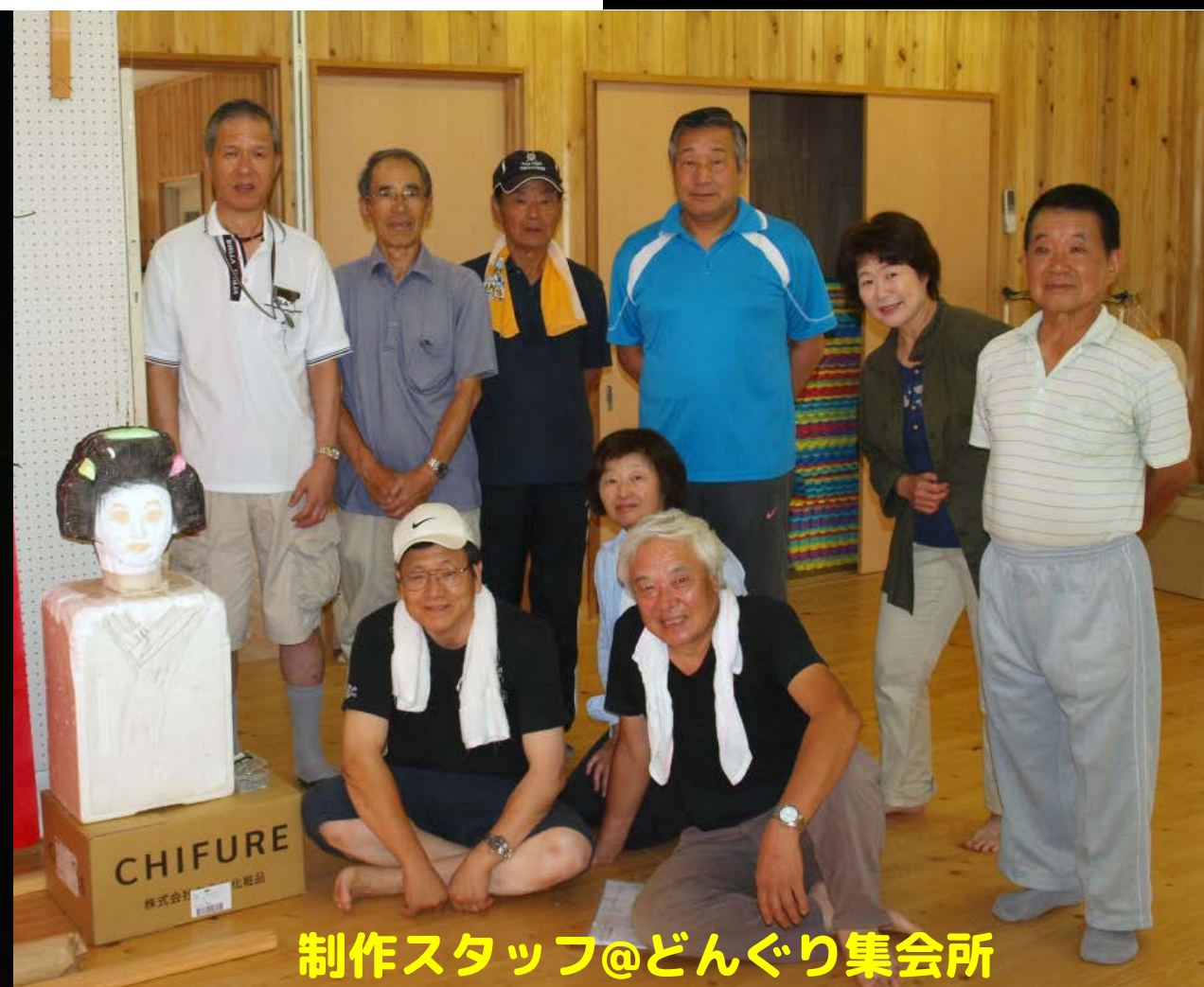
制作スタッフ@どんぐり集会所