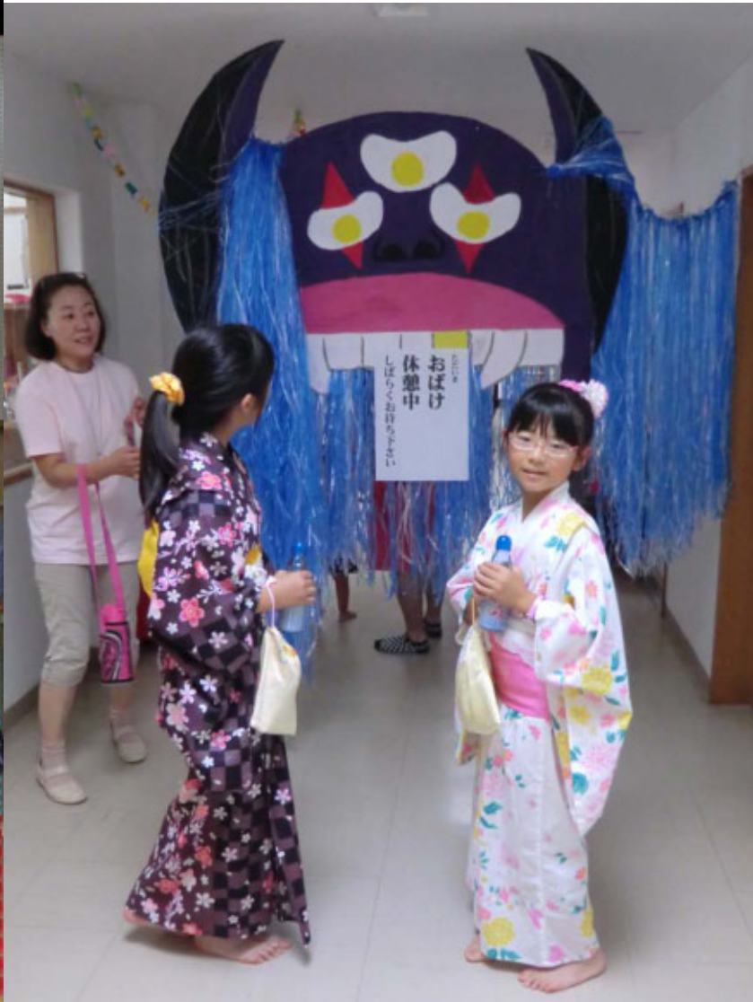
動くお婆けは激務のようです。ただいま休憩中の張り紙が…