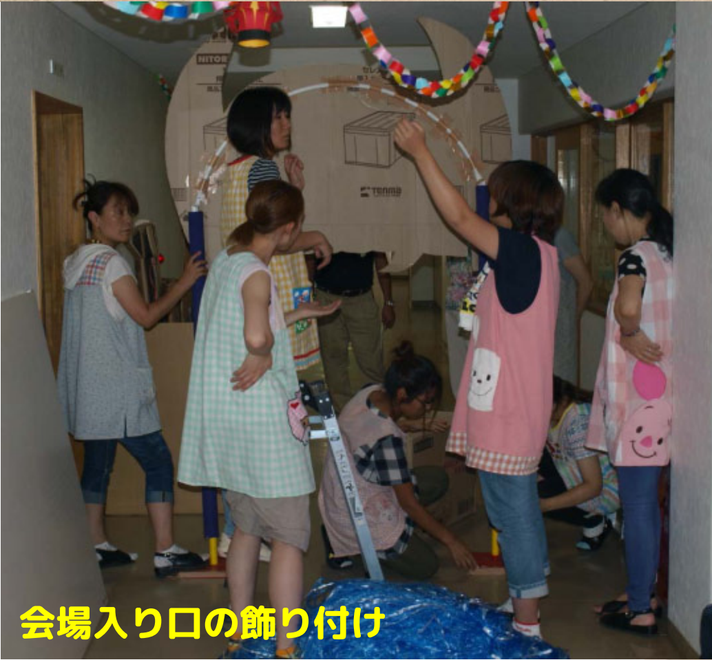
会場入り口の飾り付け