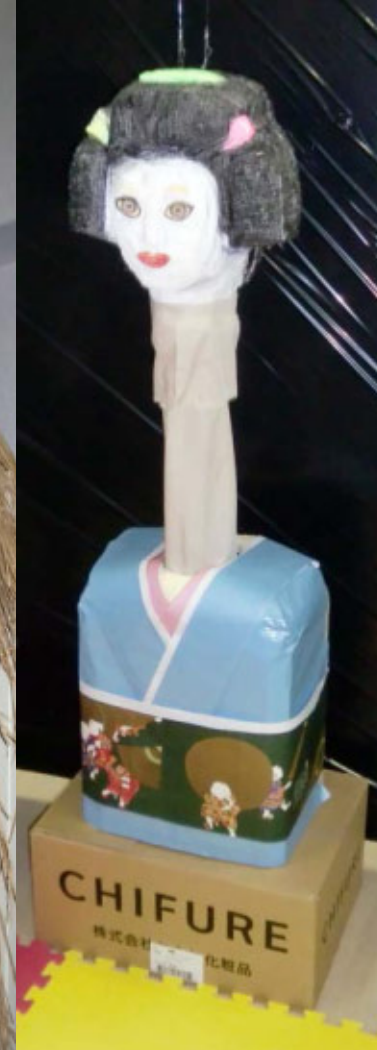
ろくろ首は奥様のストッキングだとか