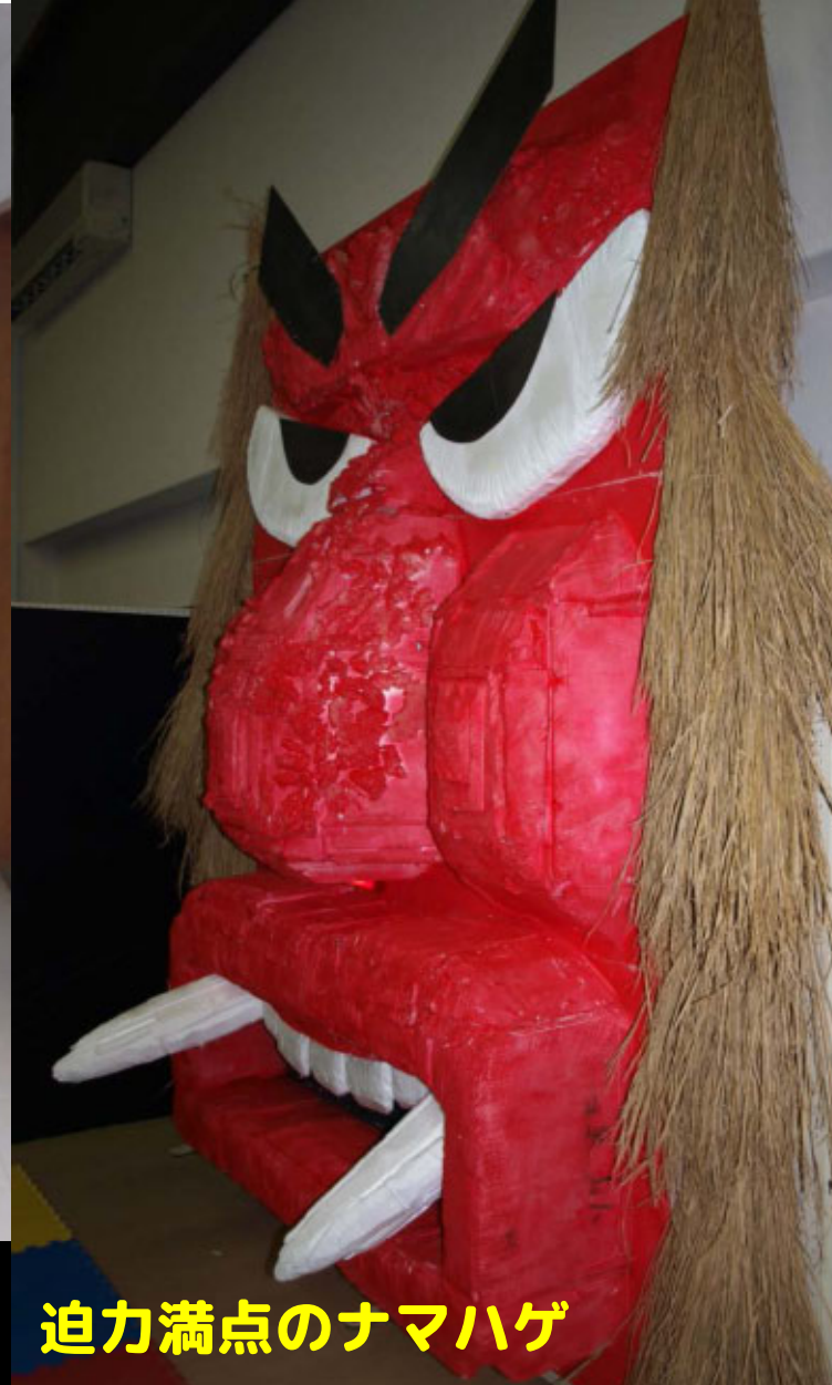
迫力満点のナマハゲ