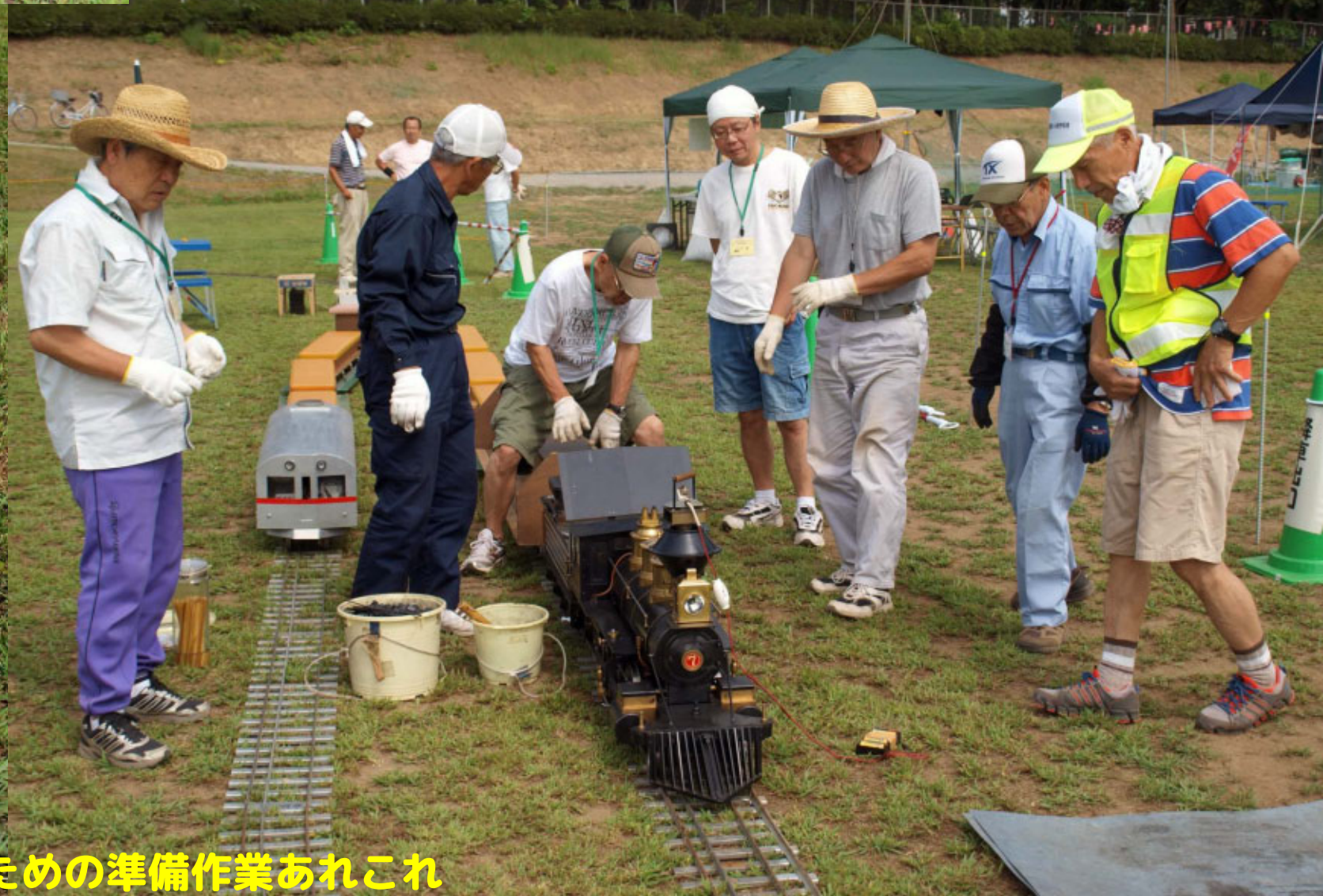
ミニSLのための準備作業あれこれ