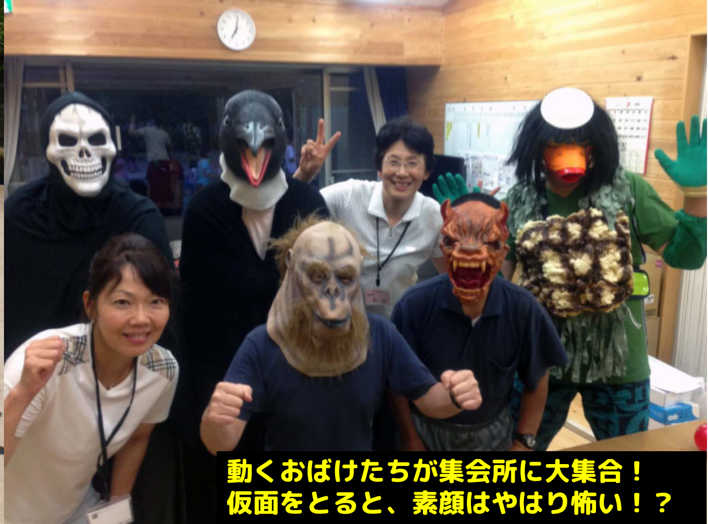
動くおばけたちが集会所に大集合！ 仮面をとると、素顔はやはり怖い！？