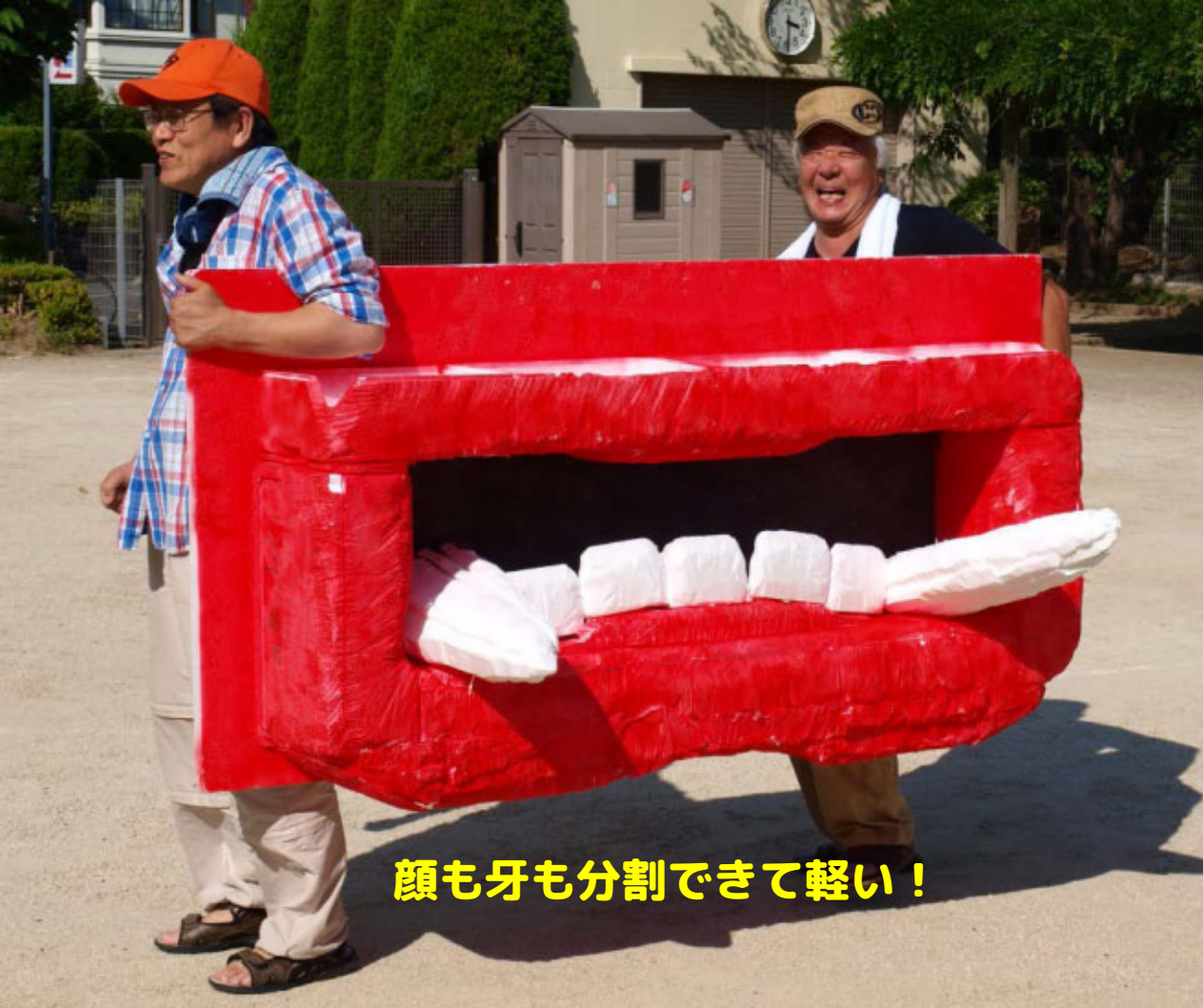
顔も牙も分割できて軽い！