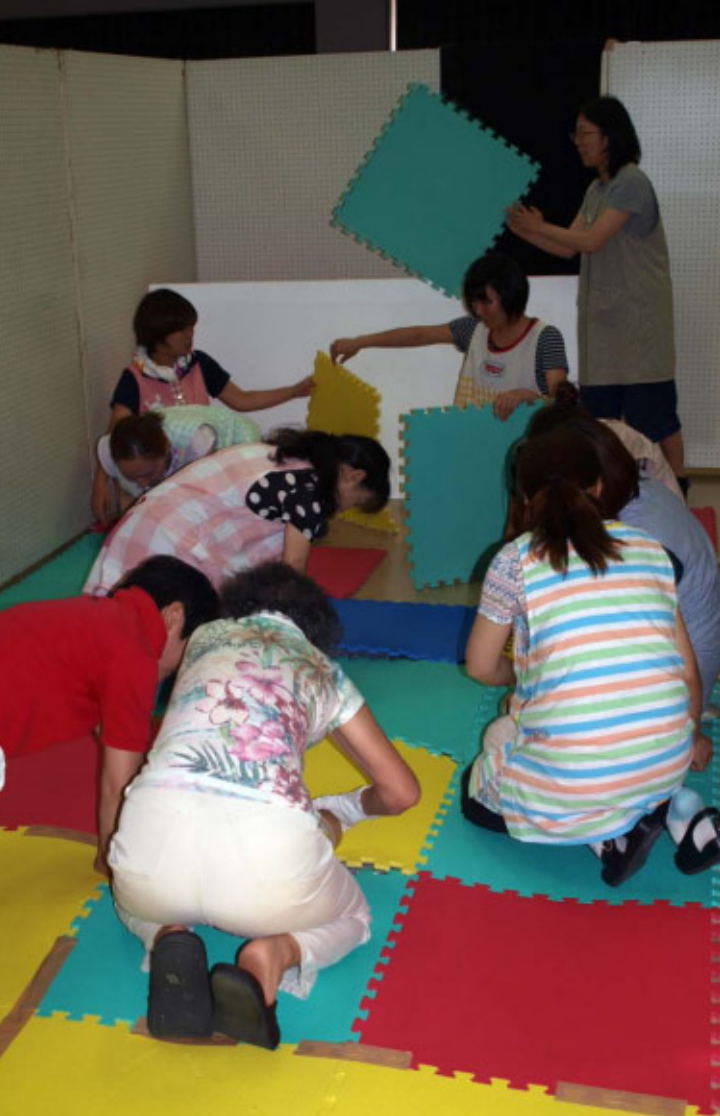
会場の足下の柔らかさを出すためにクッション張りを行う先生方