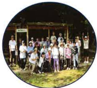
ノルディックウォーキング