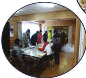
広報誌配布ボランティア

みずき野の住民が主体となって公民館を活動拠点とするサークルも多数ありますので公民館に問い合わせは如何でしょうか?