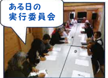
ある日の 実行委員会

参加者が集まるかどうか危ぶむ声もありましたが、やってみたら大成功!! 100名を越える参加者があり、好プレー、珍プレーで応援の皆様も一緒に楽しい一日を過ごしました。試合後の懇親会では「またソフトボール大会をやろう」という期待の声があふれました。期待に応えるため、今年は早くから実行委員会を組織し準備万端怠りなく進めました。各丁目単位で8チームが勢ぞろいしチームごとの練習会など、昨年を数段上回る盛り上がりでのなかで試合の日を迎えました。練習会、事前の戦略会議など準備怠りなく闘志満々で臨む大会の幕開けです。