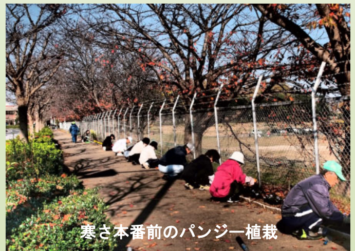
寒さ本番前のパンジー植栽

会員は現在 約30名で活動していますが花壇の面積が広い為「手」が足りない時があります。誰でも出来る作業ですので多くの方々の参加をお待ちしています。誰かが作業している時にいつでも声を掛けてください。是非ご一緒しましょう!