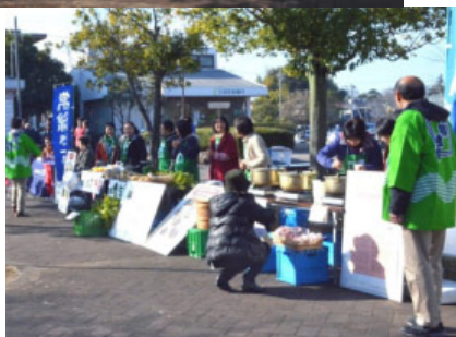
リフォーム業者相談・生協宅配移動販売

みずき野からスーパーマーケットが撤退し、高齢化が進む中、買い物に不便を感じる方の声が聞こえる様になりました。町内会でも無店舗販売・宅配・移動販売など、様々な解決策を摸索する中、実際の販売状況を実感していただきたく、生協3社の商品を紹介するフェアを開催しました。訪れた皆様からは「生協は食料品の販売にとどまらず、日用雑貨、衣料品などの取り扱い製品が増えている」と驚きの声がありました。今回のフェアをきっかけに、買い物難民を予防する解決策の検討を促進していきたいと考えています。また、昨年引き続き、みずき野にご縁があるリフォーム業者にも出展していただき、住民の相談に乗っていただきました。今後も折に触れて、このようなフェアを開催する予定です。