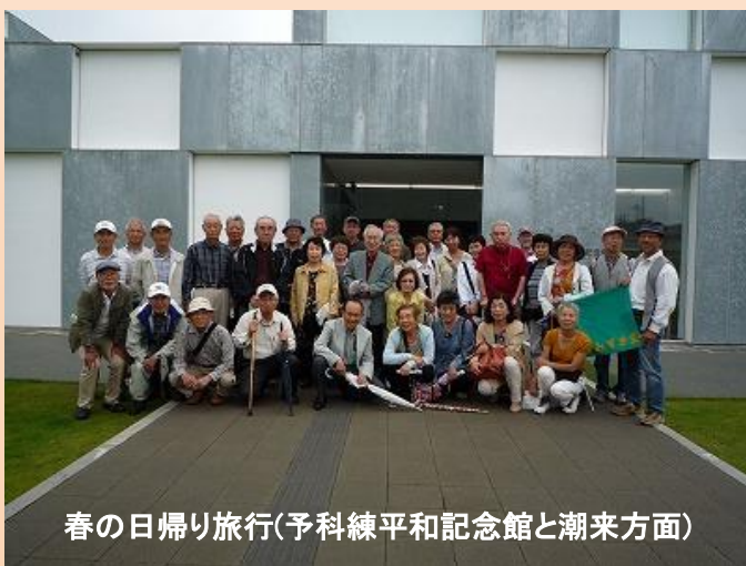
春の日帰り旅行(予科練平和記念館と潮来方面)

http://mizukikai.ii-sites.com/mizukikai >