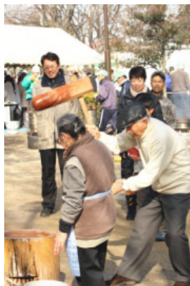
餅つき・とん汁の振る舞い