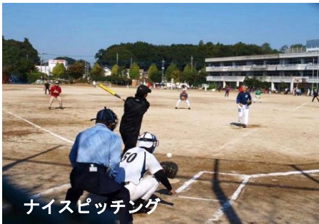
ナイスピッチング