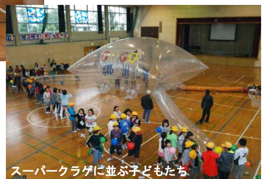
スーパークラゲに並ぶ子どもたち