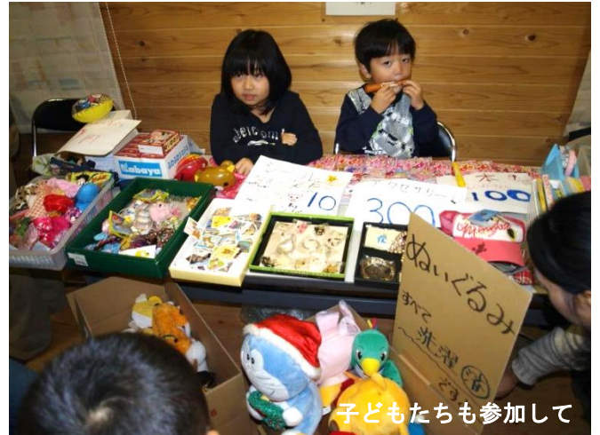
子どもたちも参加して

カレンダー、手作りアクセサリ、野菜、古着、生活雑貨、ハーブティーなどが主な販売内容。恒例のカレンダー販売には多くのリピーターが集まり、サラダクラブによるサツマイモ・カボチャ・落花生などの収穫物の販売、布きれの無料提供などもありました。来年は天候に恵まれ青空の下で開催できるといいですね。