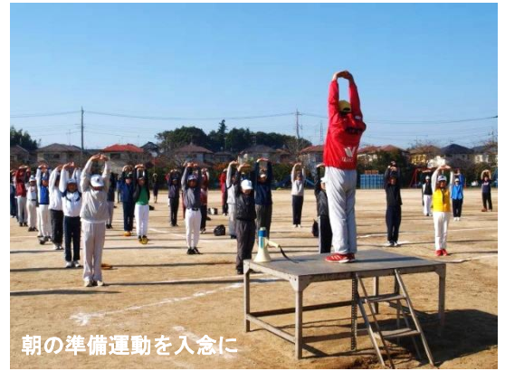
朝の準備運動を入念に

晴天の秋空の下、10月19日(日)に第4回みずき野町内ソフトボール大会が郷州小校庭で行われました。1丁目から8丁目までの各丁目で1チームを構成し、参加しやすくするために、打つだけ、守るだけなどのみずき野ルールも盛り込まれました。優勝は即席の女性応援団で試合を盛り上げた6丁目チーム。参加者が高齢化するなかで、若者の参加も増えているのが今年の特徴だったようです。全員での準備体操で始まり、試合では大きなケガもなく、最後は夕方の懇親会で締めくくりました。さて、来年はあなたも参加しませんか。