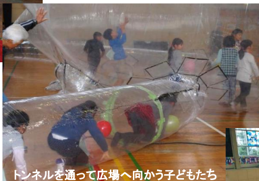
トンネルを通して広場へ向かう子どもたち

子どもたちは細いクラゲの足(トンネル)を通して、中の広い遊び場で飛び跳ねていました。子どもたちの並ぶ列が途切れない人気で、「すごく面白かった」という多くの声がありました。