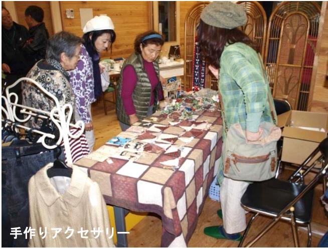
手作りアクセサリ

今年もフリーマーケットが開かれ、多くの参加者で賑わいました。当日11月9日(日)は朝から雨模様で、場所をみずき野集会所に移して20組ほどが出店しました。