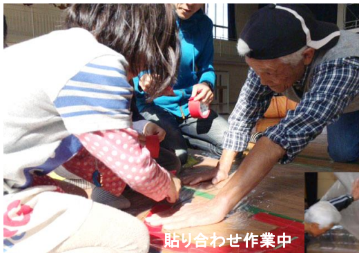
貼り合わせ作業中

郷州小のイベント「GOGO郷州」が11月8日(土)に行われました。午前中は子どもたちによる学習発表会、午後は保護者主催、地域の皆さんも参加してのお祭り(ふれあいタイム)でした。