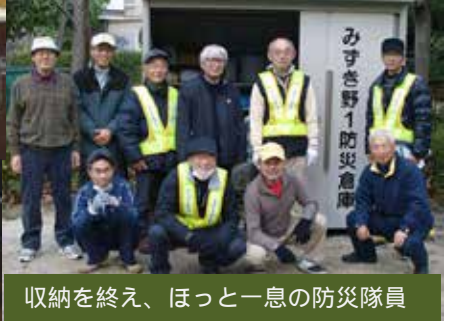
収納を終え、ほっと一息の防災隊員