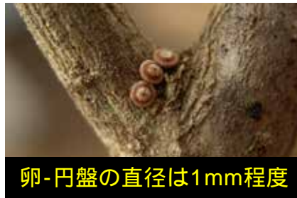
卵-円盤の直径は1mm程度

ウラゴマダラシジミ（成虫は6月上旬） 卵で越冬します。守谷の雑木林に多い低木イボタノキの枝に卵は産み付けられます。まるで空飛ぶ円盤のような不思議な形をしています。色も含めイボタノキの芽に擬態したものと思われま