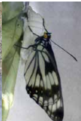
成虫-羽化した直後

ゴマダラチョウ（成虫は6月～9月） 幼虫で越冬します。2本のツノを持ったかわいらしい姿をしています。食樹のエノキの葉が緑の時期は幼虫の体も緑色ですが、秋になり葉が落ちる頃には灰褐色に変化して、根元に降りて落ち葉の裏などに隠れます。見事な葉隠れの術です。体長は約20mm。ちなみに、みずき野周辺には見られませんが、日本の国蝶オオムラサキの幼虫もこれとそっくりな姿と生態をしています。