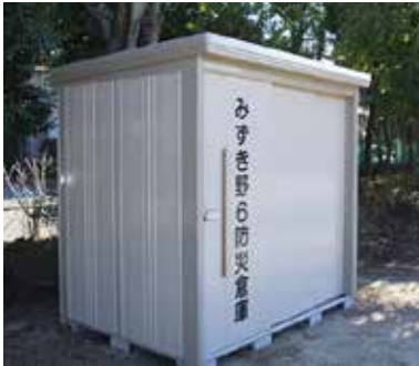
公園設置の防災倉庫

皆さまの”最寄りの公園”に防災倉庫を設置しました。12月21日(日)、自主防災隊の方々にご協力をいただき、防災機材の仕分けを行い、防災倉庫への収納を完了しました。防災機材が使われないことが一番ですが、万が一に備え、最寄りの防災訓練に参加してください。また、防災倉庫の位置は、災害発生時の”丁目指揮所”に当たります。(山下 勝博)