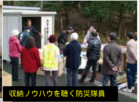
収納ノウハウを聴く防災隊員