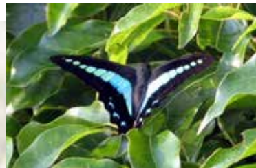
クスの葉上で休む成虫