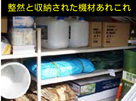
整然と収納された機材あれこれ