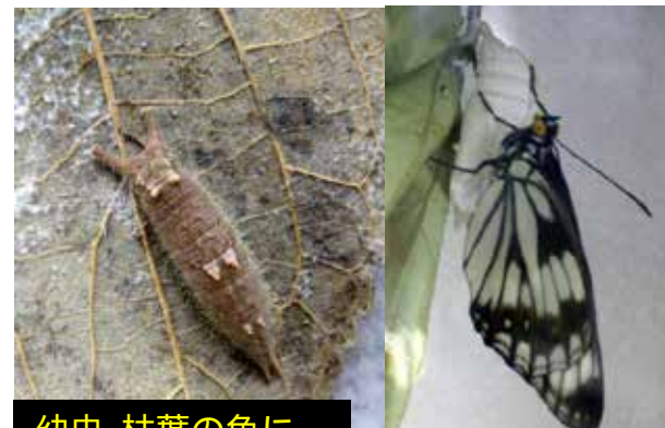
幼虫-枯葉の色に擬態している