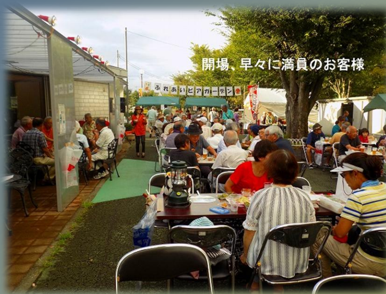
開場、早々に満員のお客様