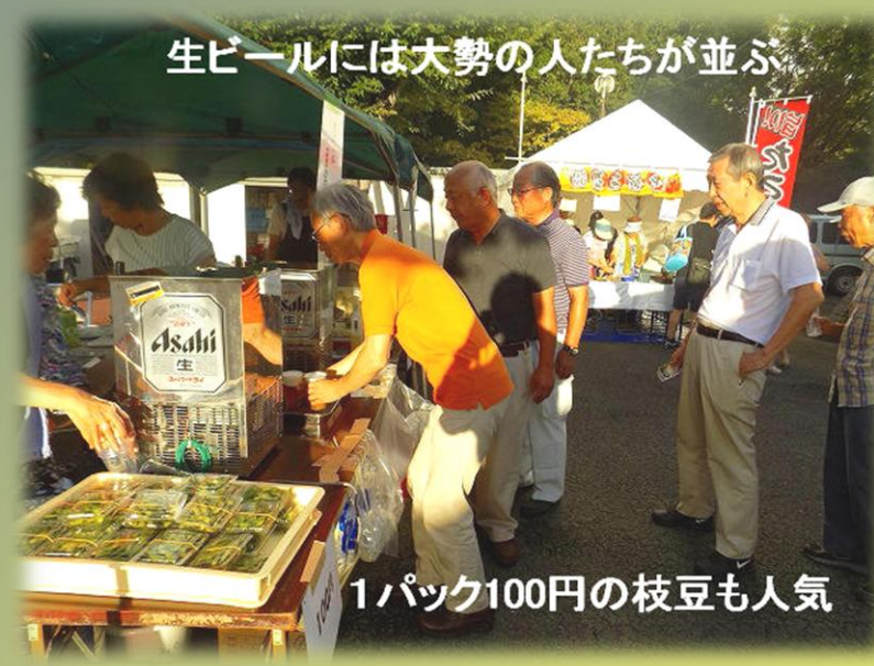
生ビールには大勢の人たちが並ぶ