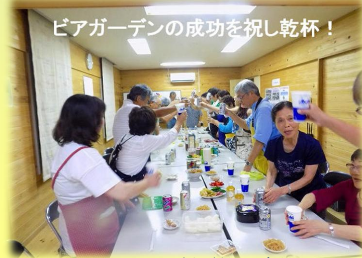
ビアガーデンの成功を祝し乾杯！