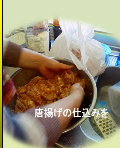
唐揚げの仕込みを