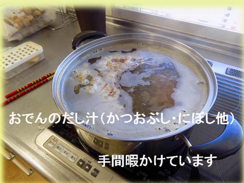
おでんのだし汁(かつおぶし・にぼし他) 手間暇かけています