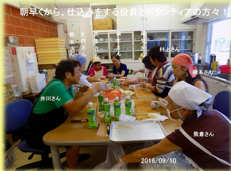
朝早くから、仕込みをする役員とボランティアの方々！