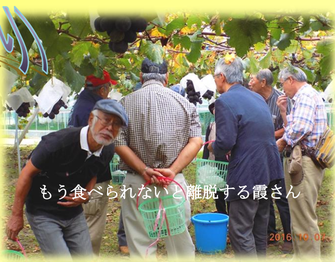
もう食べられないと離脱する霞さん