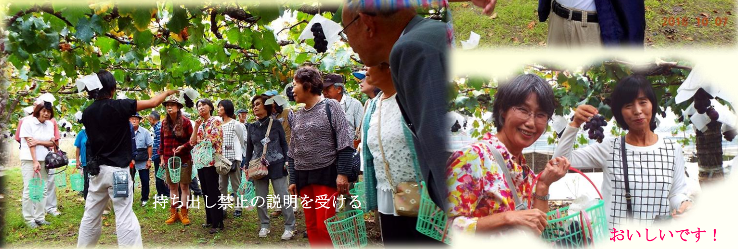
持ち出し禁止の説明を受ける