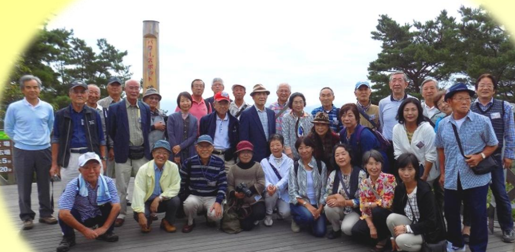
昇仙峡、ロープウェー頂上 パノラマ台駅にて