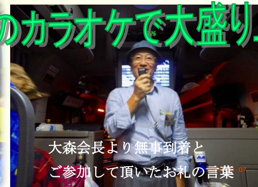
大森会長より無事到着とご参加して頂いたお礼の言葉