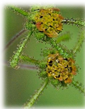
コメナモミ 実が成熟した頭花 10月下旬