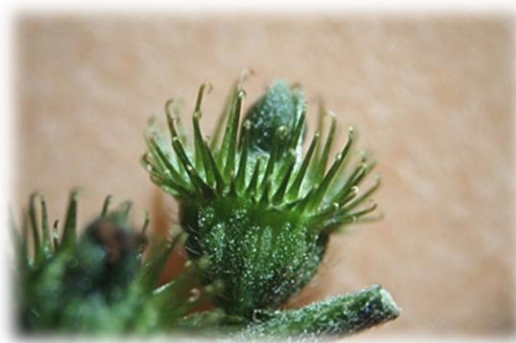
キンミズヒキの実の拡大像 10月中旬 第2調整池北隣接地にて採集