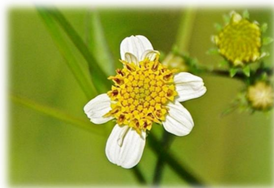
コシロノセンダングサの花 10月上旬 8丁目東隣接地

コセダングサの花には舌状花 ぜっじょうか はないのですが、変種であるコシロノセンダングサには右の写真のように白い舌状花 ぜっじょうか があります。しかし、ひっつきむしの形はコセダングサとまったく同じです。