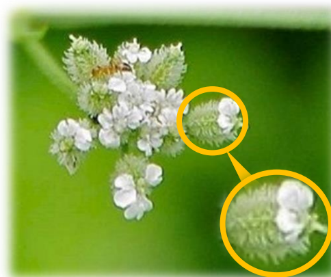
ヤブジラミの花 7月上旬 本町地区

初夏にはセリ科のヤブジラミの実がひっつきむしになります。実には多数の先の曲がった棘が生え、動物や人にくっつきます。将来実になる子房の表面には、ひっつきむしとなることを予想させる棘がたくさん生えています。ヤブジラミもみずき野周辺に多数見られます。