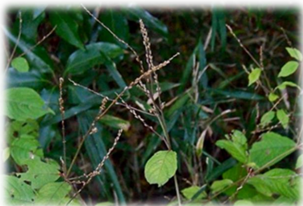
ヒナタイノコヅチ 11月中旬 本町地区

イノコヅチの仲間はヒユ科の植物で、普通に見られるものにイノコヅチ(別名ヒカゲイノコヅチ)とヒナタイノコヅチとがあり、前者は林のへりのような日陰に見られ、後者は日当りのよい場所に見られます。両種はごく近縁で、互いによく似ており、葉や実に多少の違いが見られる程度です。どちらともごく普通の植物で、多量のひっつきむしをつくります。下の写真はヒナタイノコヅチで、実には2本の棘 とげ がついています。この棘 とげ は小さな葉が変形したもので、これによって動物や人にくっつきます。