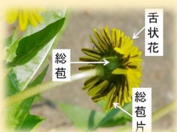
タンポポの花の構造

ヒマワリの花の構造 キク科の植物の花は茎または枝の頂 ちよう 端 たん につ とう き、頭 とう にな とう ぞらえて頭花 とう または頭状花 とう と呼びます。頭花はひとつの花に見えますが、実際は多数の花の集合です。花びらのように見えるものは舌状花 ぜつじよう と呼ばれ、それぞれがひとつの花 とう です。頭花の中央には小さな管状の花が集まっています。これらの花を管状花 かんじよう または筒状花 とうじよう と呼びます。なお、キク科植物の頭花には、管状花のないもの(タンポポの仲間など)や舌状花のないもの(本文で紹介するコセンダングサなど)もあります。