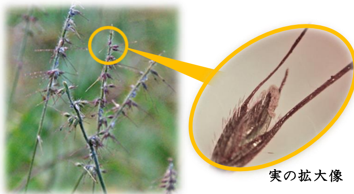
ケチヂミザサ 11月中旬 本町地区

で述べているように、イネ科植物の種子は外穎 がいえい と内穎 ないえい に囲まれています。多くの場合、外穎 がいえい の先端 のぎ には芒という針状の