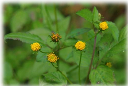
コセダングサの花 10月下旬 本町地区