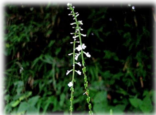
ハエドクソウ 7月下旬 本町地区

ハエドクソウはハエドクソウ科の植物で、成熟した実は萼 がく に包まれています。萼 がく の先端には3本の先の曲がった棘 とげ がついていて、萼 がく に包まれた実が動物や人にくっつきます。