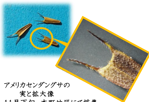
アメリカセンダングサの 実と拡大像 11月下旬 本町地区にて採集