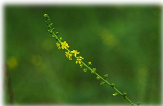
キンミズヒキ 9月中旬 第2調整池北隣接地

キンミズヒキはその名からミズヒキの近縁と思われがちですが、キンミズヒキはバラ科、ミズヒキはタデ科で、互いに縁のない植物です。ミズヒキはひっつきむしは作りませんが、キンミズヒキの実は、先端の曲がった棘をもつひっつきむしです。