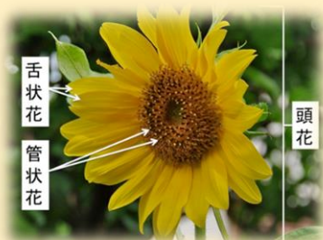
ヒマワリの花の構造

キク科の花の構造については、本コラム第3回「タンポポと類似の野草たち」で説明しましたが、おさらいをしておきましょう。代表として選んだのは、ヒマワリとタンポポです。これらはもちろんひっつきむしを作りません。