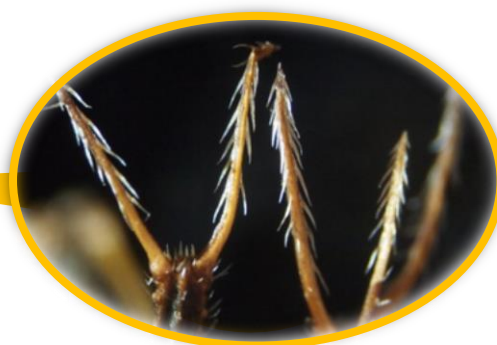
ズボンに付着したコセダングサの実と先端の拡大像 11月下旬 8丁目東隣接地

コセダングサのひっつきむしは先端に2本または3本の鋭く尖った角 とが が生えています。顕微鏡で拡大して見ると、それらの角 つの にはいくつもの棘 とげ が逆向きに生えていることがわかります。この棘 とげ によって動物や人にくっつくのです。ひっつきむしは遠くに運ばれたのち、どこかで離れて地上に落ち、春になると中の種子が発芽します。