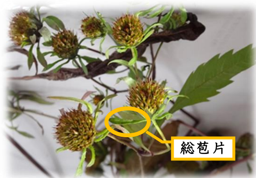
アメリカセンダングサの花 11月下旬 本町地区にて採集

アメリカセンダングサは頭花の下に葉のような形をした細長い総苞片 そうほうへん があり、他のセンダングサの仲間と区別できます。アメリカセンダングサのひっつきむしはコセンダングサより短く、幅は広く、先端に2つの角 つの をもっています。角にはコセンダングサと同様、逆向きの棘 とげ が生えています。