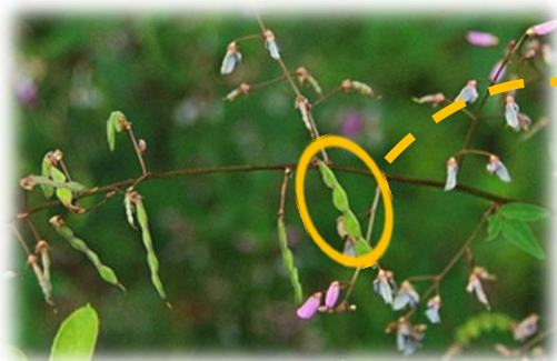
アレチヌスビトハギ 9月中旬 第2調整池北隣接地

みずき野周辺には、ヌスビトハギ、マルバナヌスビトハギ、アレチヌスビトハギが見られます。これらについては本コラム 第6回「『ハギ』と名の付く植物たち 」を参照してください。今回はアレチヌスビトハギの莢の写真を載せておきます。