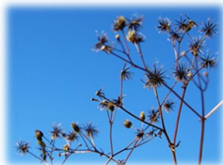
コセダングサの実 11月下旬 8丁目東隣接地