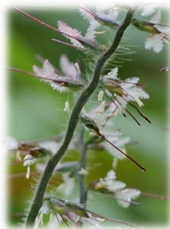
ケチヂミザサの花 10月下旬 本町地区

ちなみにチヂミザサの花は10月頃咲き、小さいので目立たないのですが、近づいてみるととてもきれいです。雌しべと雄しべは穎の外に出てきます。ピンクまたは白い刷毛状のものが雌しべで、系の先に吊り下がって見えるものが雄しべです。