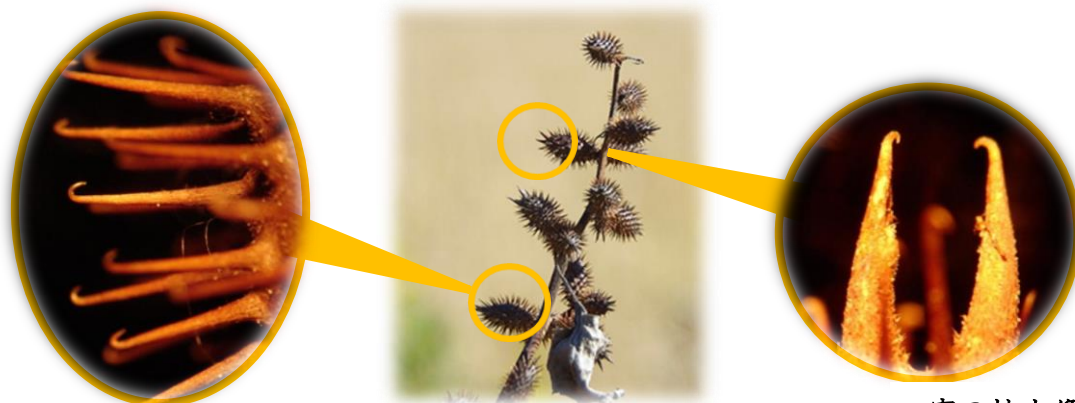
実の拡大像 (側面部)