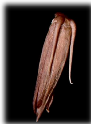
ヒナタイノコヅチの実の拡大像 12月下旬 本町地区にて採集