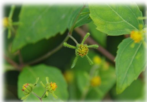
コメナモミの花 10月下旬 本町地区

コメナモミの頭花の下には長い棍棒状の総苞片があり、粘液を含む腺毛が多数ついています。また、花床の一部が変形して生じた鱗状の組織(鱗片)があり、頭花を囲んでいます。この鱗片の表面にも多数の腺毛が見られます。実は成熟するとこれらの腺毛から出る粘液でべとべとになり、頭花ごと動物や人にくっつきます。